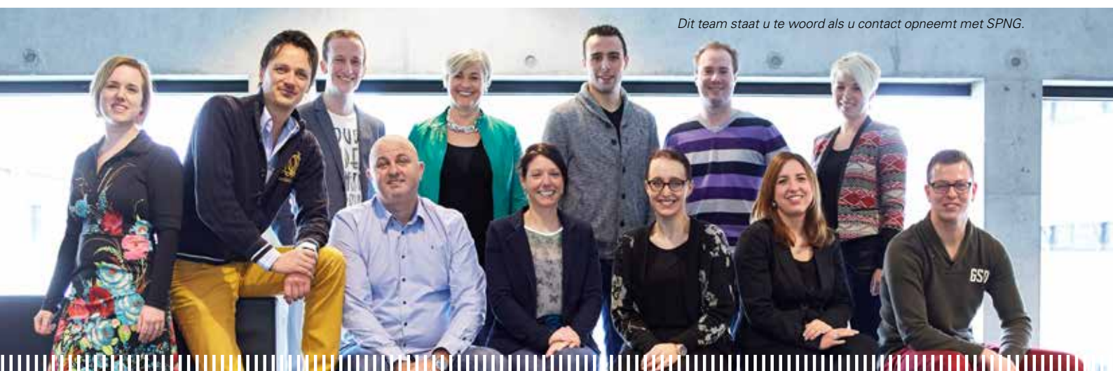
Dit team staat u te woord als u contact opneemt met SPNG.

U vindt veel informatie op www.spng.nl . U kunt ons ook bellen: 045 - 5763 687 (elke werkdag van 8.30 tot 17.00 uur) of mailen: spng@azl.eu .